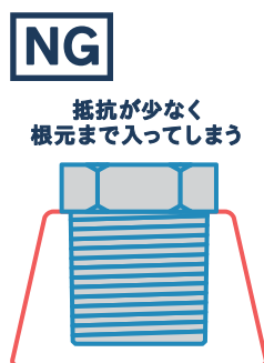
PTおねじ × NPTめねじ