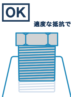
PTおねじ × PTめねじ